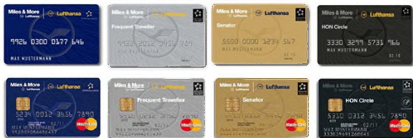
Miles & More Service Cards & Credit Cards – Miles & More 里程卡仅供积分累计及兑换使用 For Earn and Spend only